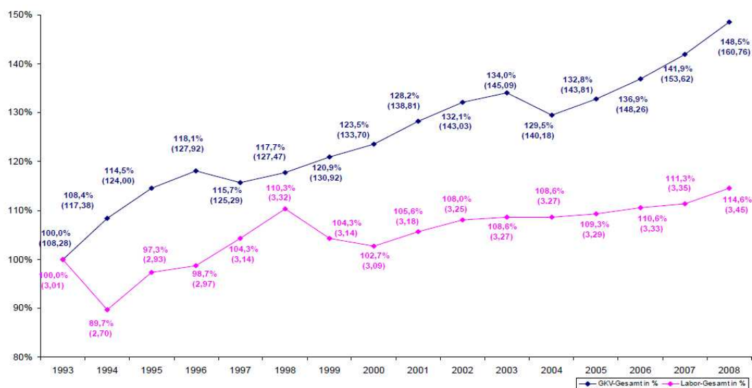
Rise in Total GKV and Laboratory Expenditure (Hospital and Practitioner Segments) in Germany since 1993 (in billion €)

Οι δαπάνες για διαγνωστικά ανέρχονται σε ποσοστό περίπου 2,2% των συνολικών δαπάνων του γερμανικού συστήματος υγείας, με το ρυθμό αύξησης τους να είναι χαμηλότερος από το ρυθμό αύξησης δαπανών του συστήματος υγείας συνολικά και το μερίδιό τους επί του συνόλου να περιορίζεται. Έτσι, με έτος αναφοράς το 1993, το 2007 οι δαπάνες για διαγνωστικά είχαν αυξηθεί κατά 14,6%, ενώ συνολικά οι δαπάνες του δημόσιου συστήματος υγείας κατά 48,5%.